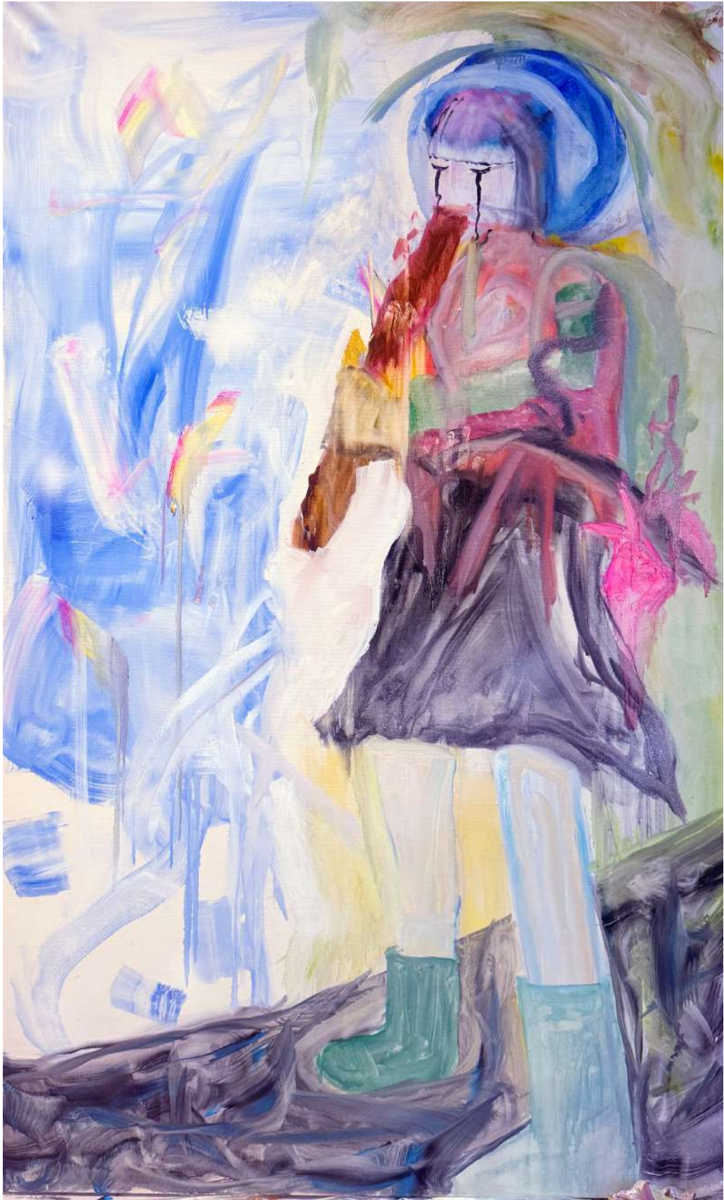
"笛をふきながら新宿の朝方をうろつく少女" Oil on canvas 1620x970 2026