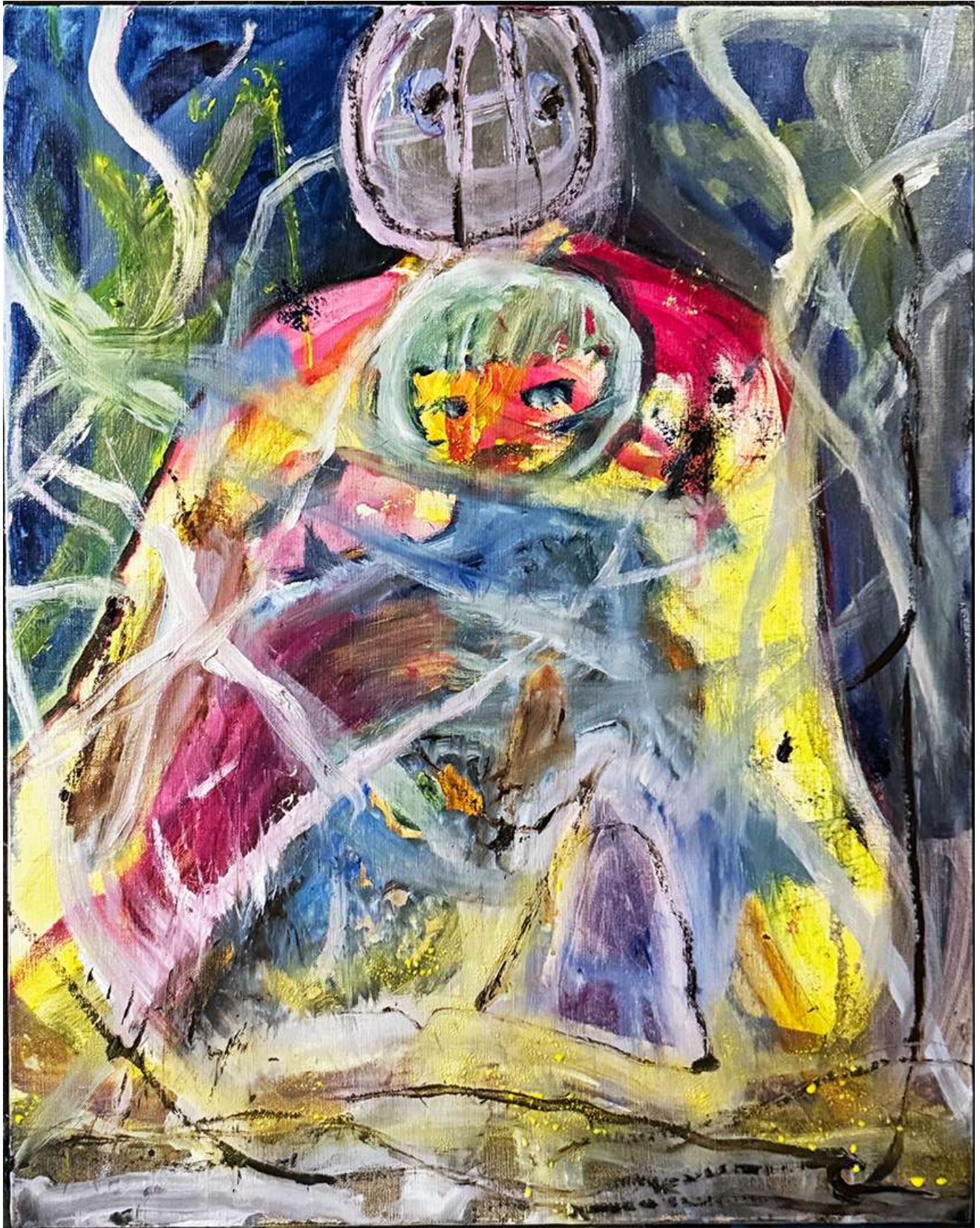
小さい夜 油彩、オイルパステル、エアブラシ 652×530mm 2026