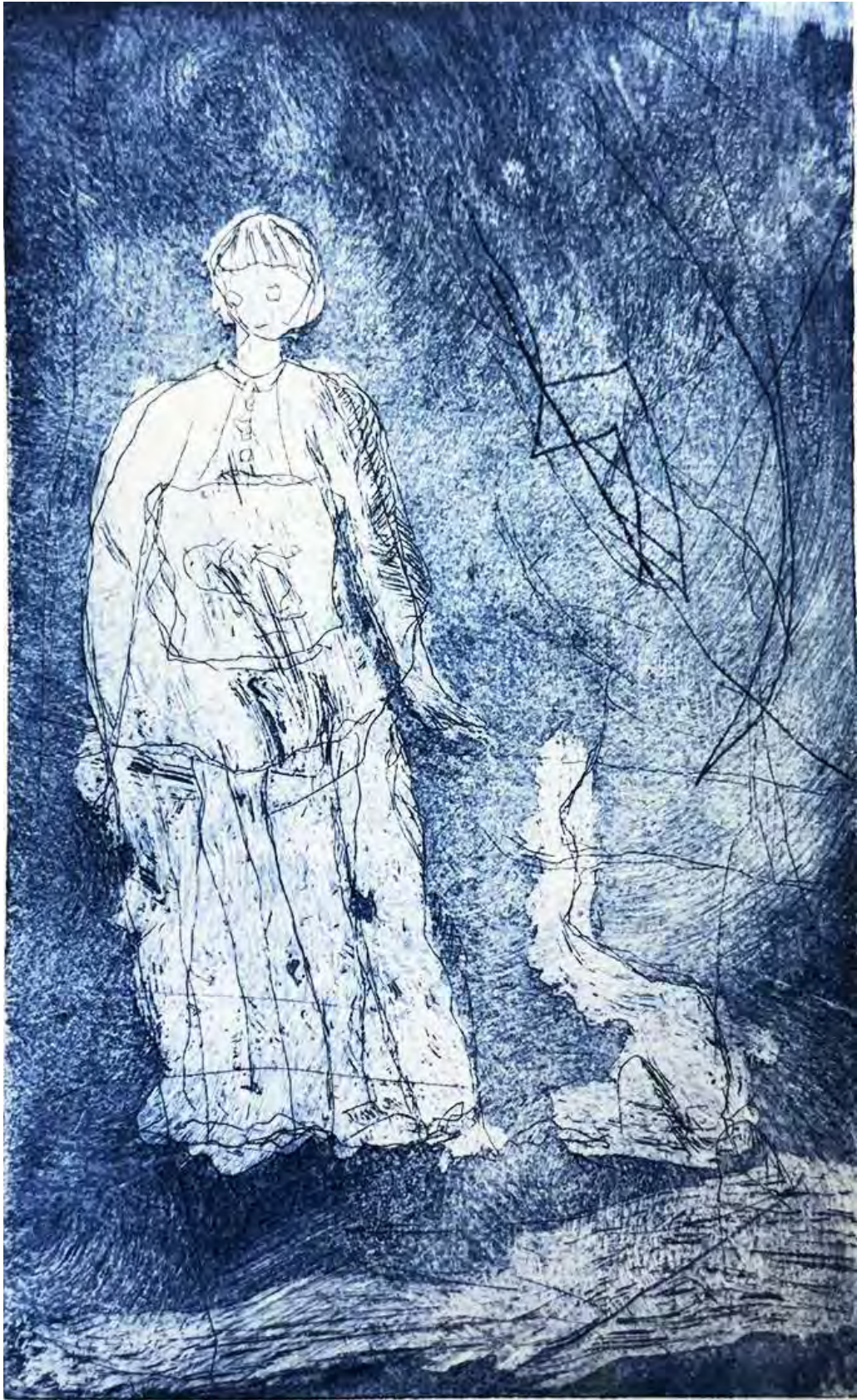
よるのさんぽ. 2025 銅版画