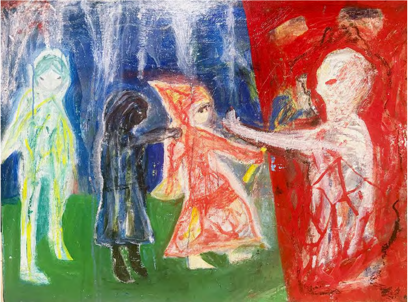
A Certain Story