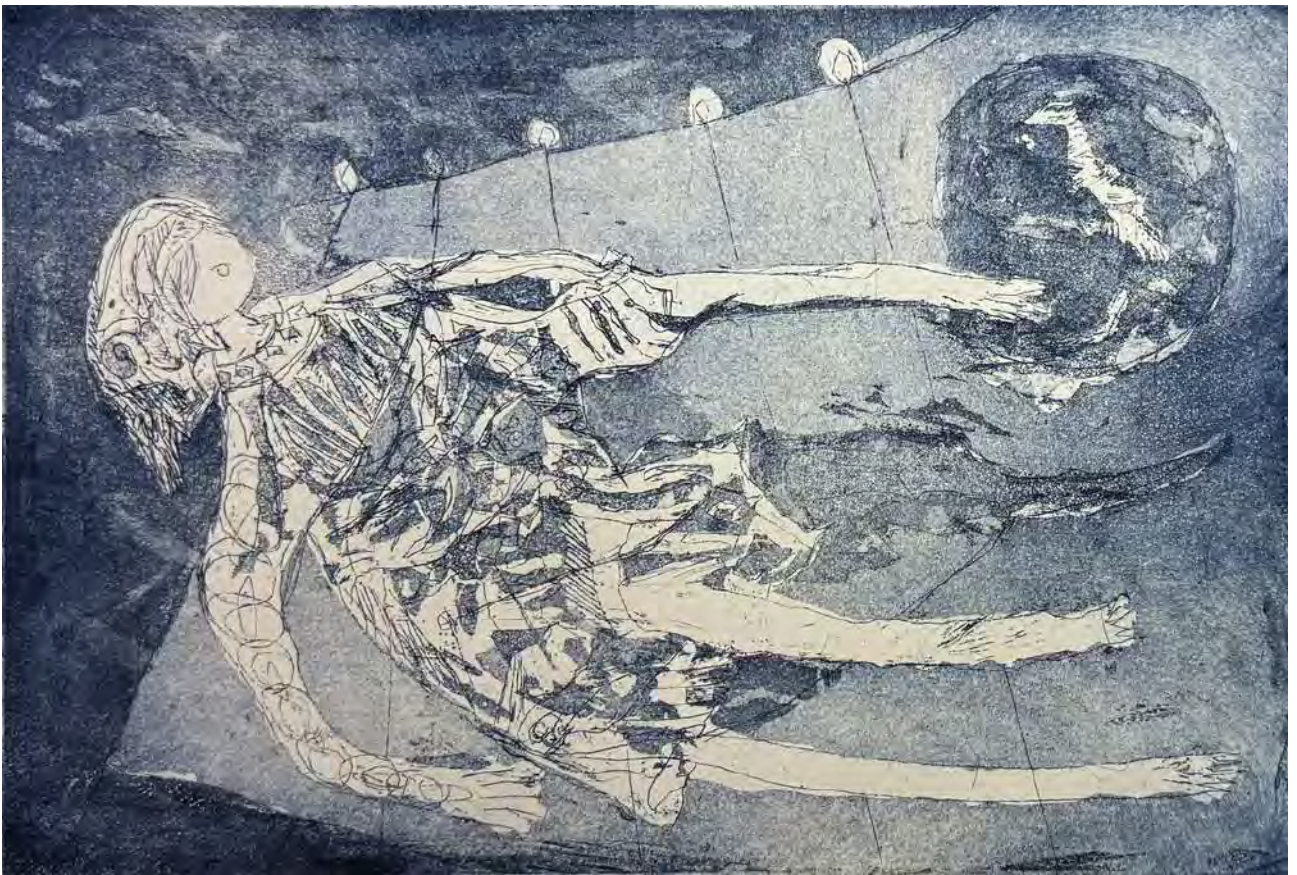
無題. 2025 銅版画