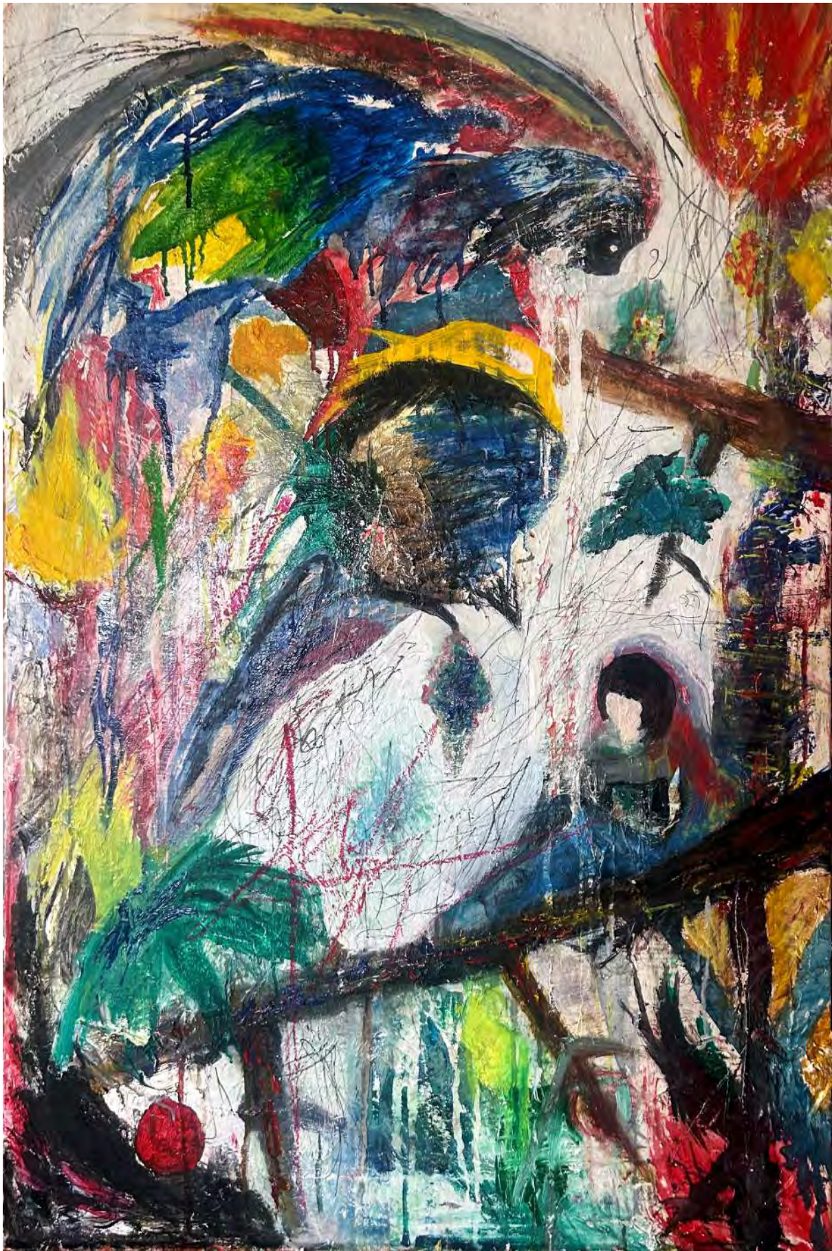
不可能なほどに浅い眠り 2024 パステル、油絵具、ボールペン、キャンバス、 1000x652mm