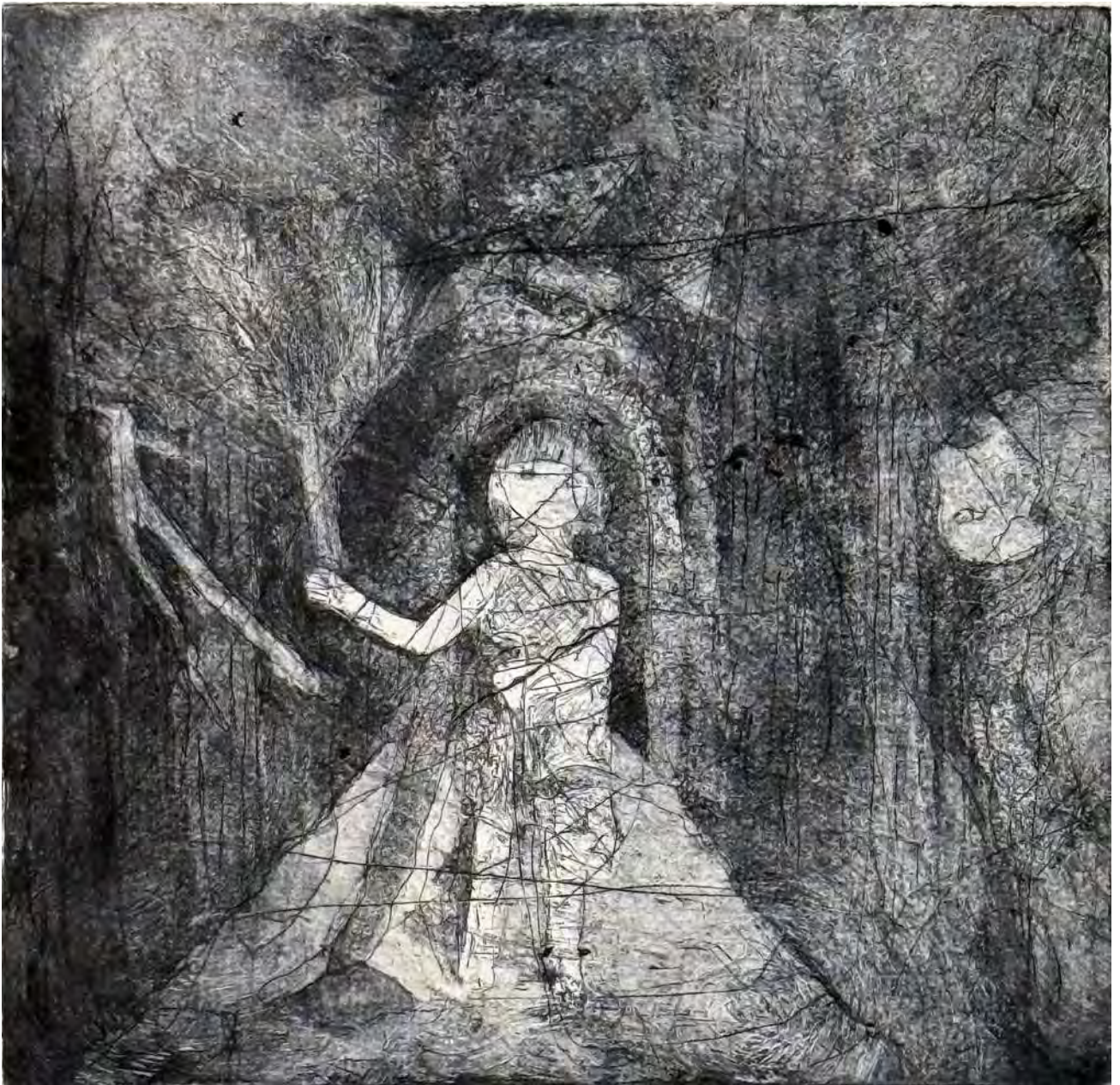
かえりみち . 2025 銅版画