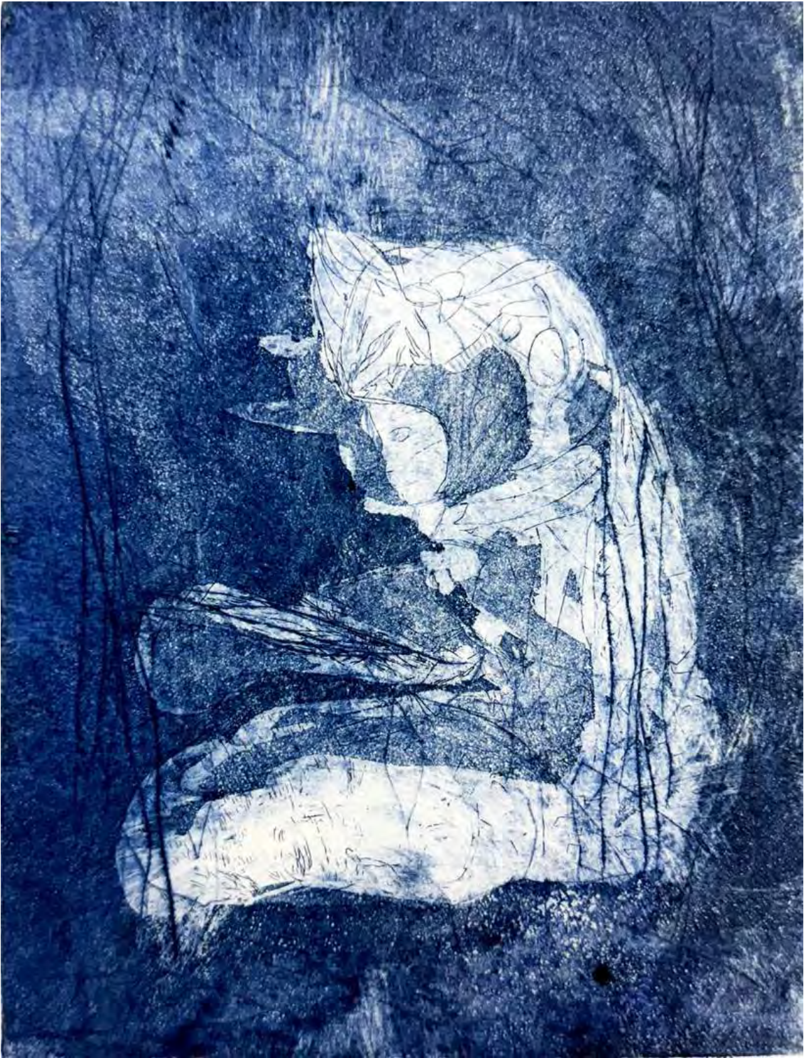
潜む. 2025 銅版画