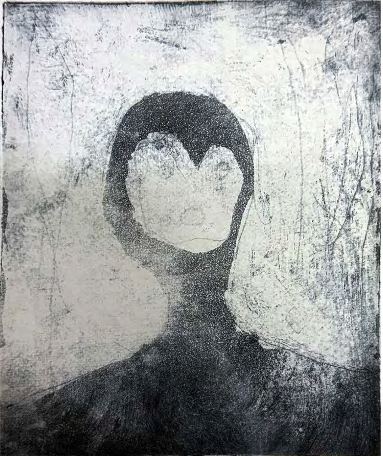
見えない. 2025 銅版画