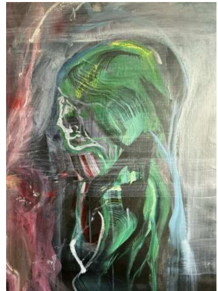
まだ名前のない子