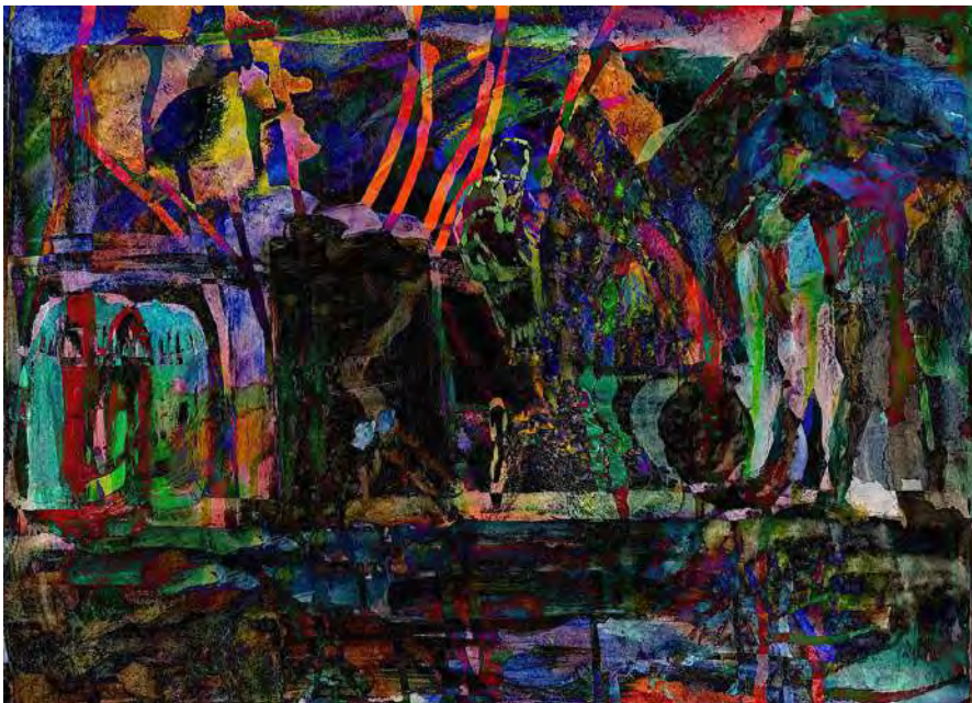
無題. 2025 ドローイング